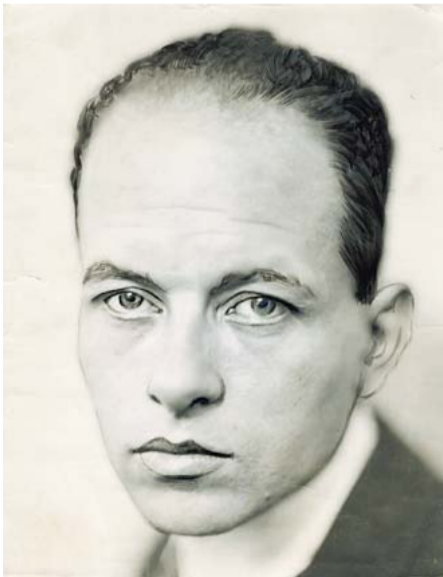
Pierre Drieu La Rochelle

Gleich zu Beginn geht er auf Distanz zum „vulgären Antisemitismus“, dem zufolge die gesamte westliche Kultur seit 1918 degeneriert, zersetzt, „verjudet“ sei. Vielmehr hätten sich die Juden gern selbst zu Anführern künstlerischer Tendenzen stilisiert. Doch die ästhetischen Entwicklungen verliefen in viel längeren historischen Bögen. Das beweise etwa der psychologische Roman seit Stendhal mit seiner Vitalität: Um die Exploration des Inneren der Figuren gehe es auch Gide,